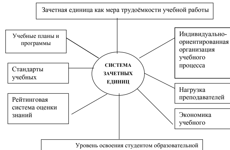
Схема 6. Роль системы зачетных единиц в учебном процессе.

Зачетная единица выступает не просто как оценка в других терминах, а как мера трудоёмкости учебной работы. Связь с составляющими учебного процесса представлена на схеме 5.